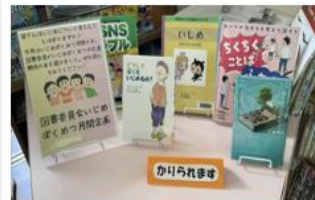
図書委員会 本の紹介